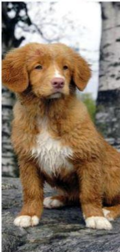
NOVA SCOTIA DUCK TOLLING RETRIEVER.

* Vedtatt av Norsk Kennel Klubs Hovedstyre 22.05.2008, revidert 08.12.2009. Tillegget i pkt 2 samt forandringen i pkt 7, første strekpunkt gjelder fra 01.07.2010. Oppdatert etter NS-vedtak 08.06.2011 (fotnoter pkt 2), 21.06.2012 (tillegg siste setning pkt 3), 27.08.2012 (tillegg nest siste setning pkt 3) og 04.09.2012 (forandret ordlyd på 7, 3. strekpunkt). Reaksjonsmåter for brudd på grunnreglene er oppdatert etter NS-vedtak 11.11.2011.