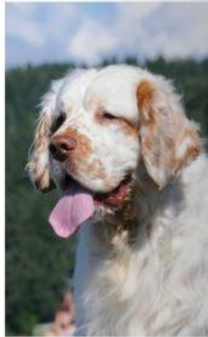
CLUMBER SPANIEL.

4.1. Bare funksjonelt, klinisk friske hunder skal brukes i avl. Hvis nære slektsninger av en hund med en kjent eller antatt arvelig sykdom brukes i avl, bør den pares med en hund som kommer fra en familie med lav eller ingen forekomst av tilsvarende sykdom.